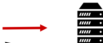
Web サーバー及びデータベース