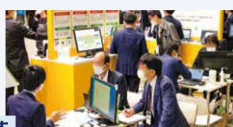
全てのブースで座って商談ができます